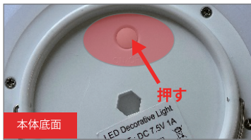
1. 本体側底面の主電源を押して点灯させる。