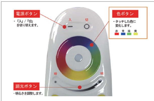
9種類の点滅パターンは速度の調整ができます。 4種類のグループに分けられますので思い通りの演出が可能です。