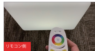
3. 本体が白く9回点滅したら解除完了。