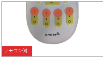
2. リモコン側のグループ設定オンボタンの1~4のいずれかを 3秒以内 に押す。