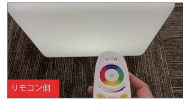
3. 本体が白く3回点滅したら設定完了。