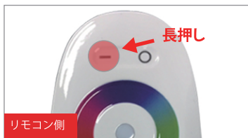
2. リモコン側のオンボタンを3秒以内に 長押し する。