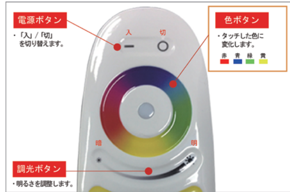
お好みの色で明るさ調整も可能です。