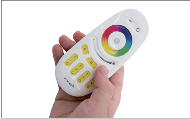
光る家具 クラシオン用タッチパネルリモコン