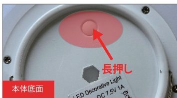
1. 本体側底面の主電源を押して点灯させる。